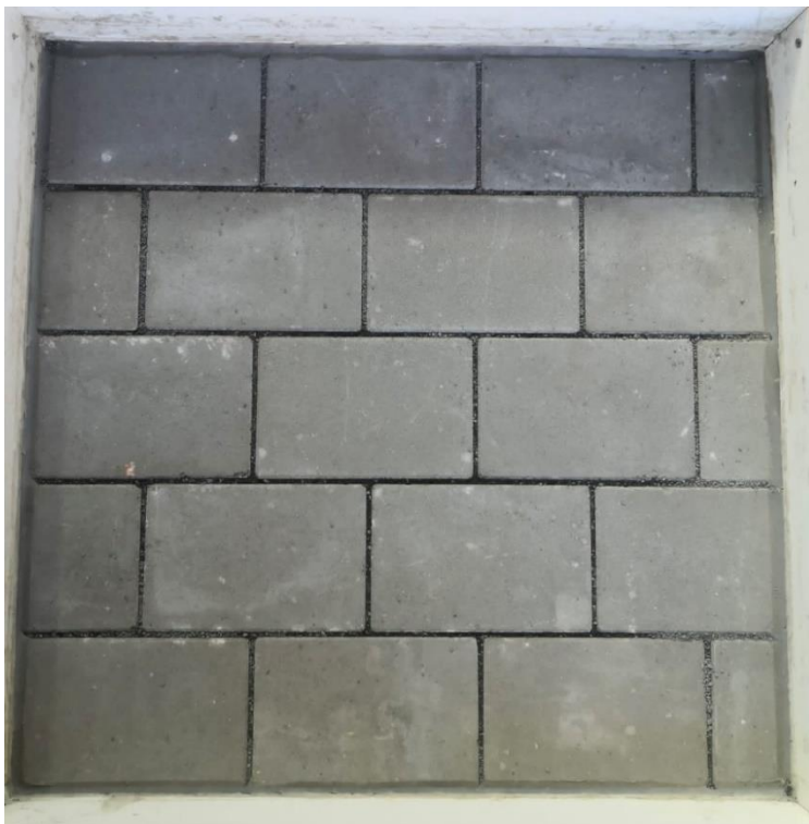
Abbildung 1: Prüffläche mit Fugenverfüllung

(Die auf der Abbildung sichtbare umlaufende Fuge um die Prüffläche wurde an den geschnittenen Seiten der Steine (zwei Seiten) zusätzlich abgedichtet).