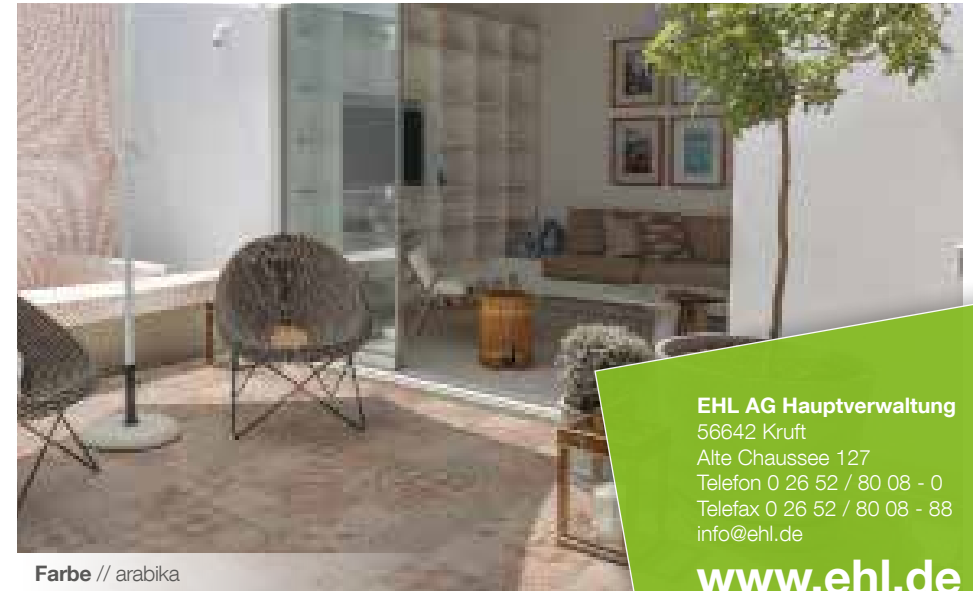
Farbe // arabika

Verlegebeispiele zum jeweiligen Produkt finden Sie auf www.ehl-for-diy.de