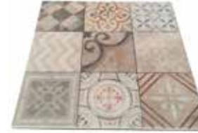
60 x 60 x 3,2 cm