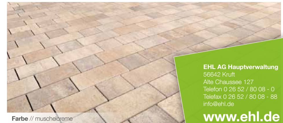
Farbe // muschelcreme

Verlegebeispiele zum jeweiligen Produkt finden Sie auf www.ehl-for-diy.de