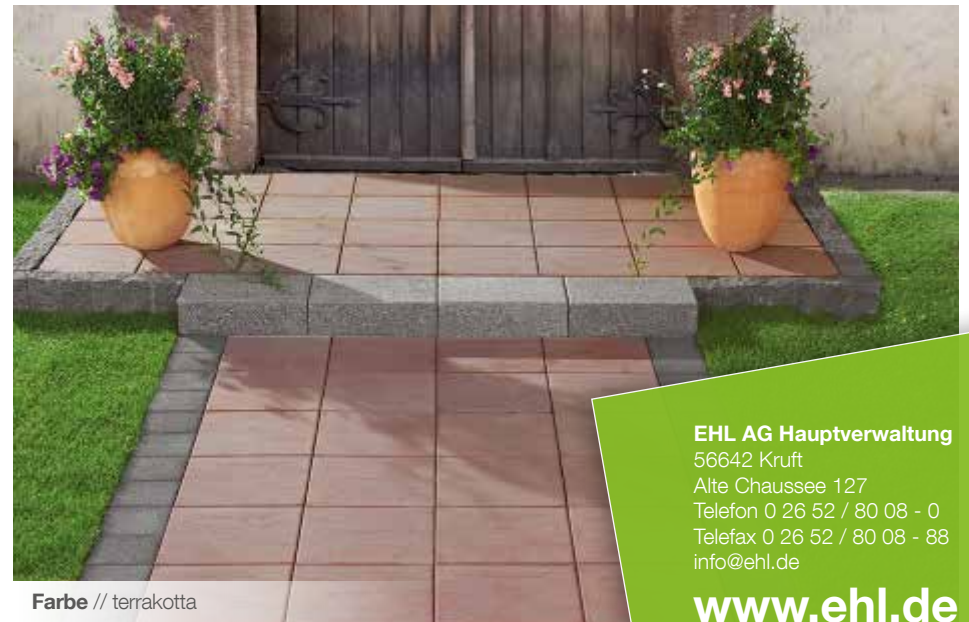
Farbe // terrakotta

Verlegebeispiele zum jeweiligen Produkt finden Sie auf www.ehl-for-diy.de