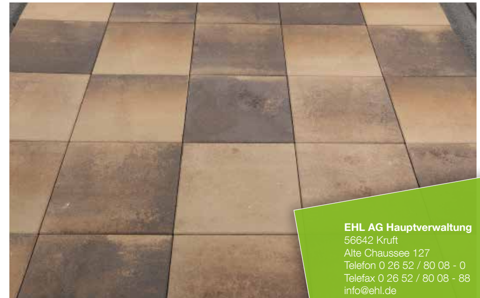
Farbe // muschelcreme

Verlegebeispiele zum jeweiligen Produkt finden Sie auf www.ehl.de