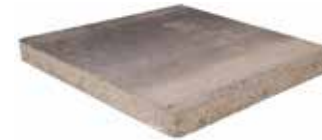
50 x 50 x 5 cm