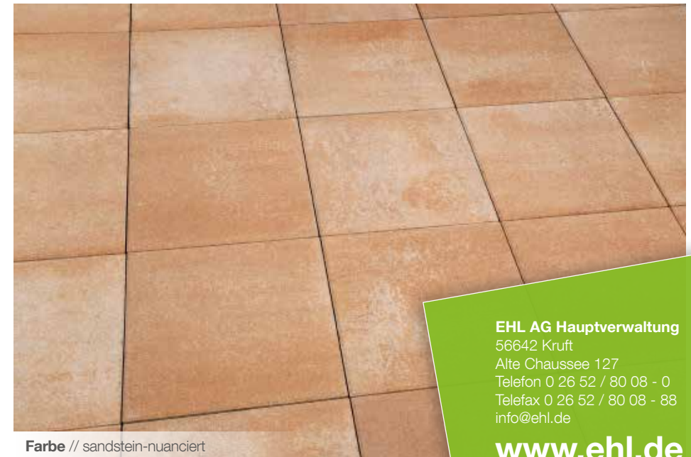
Farbe // sandstein-nuanciert

Verlegebeispiele zum jeweiligen Produkt finden Sie auf www.ehl.de