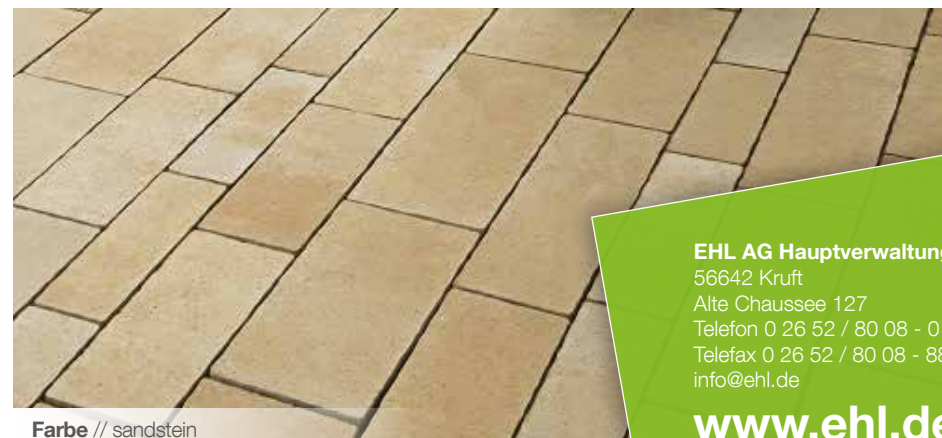
Farbe // sandstein

Verlegebeispiele zum jeweiligen Produkt finden Sie auf www.ehl-for-diy.de