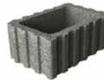
60 x 40 cm