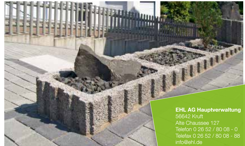
Farbe // grau

EHL AG Hauptverwaltung 56642 Krufft Alte Chaussee 127 Telefon 0 26 52 / 80 08 - 0 Telefax 0 26 52 / 80 08 - 88 info@ehl.de