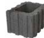
30 x 40 cm