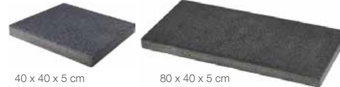
40 x 40 x 5 cm