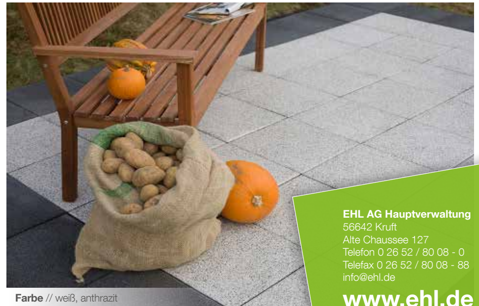
Farbe // weiß, anthrazit

Verlegebeispiele zum jeweiligen Produkt finden Sie auf www.ehl-for-diy.de