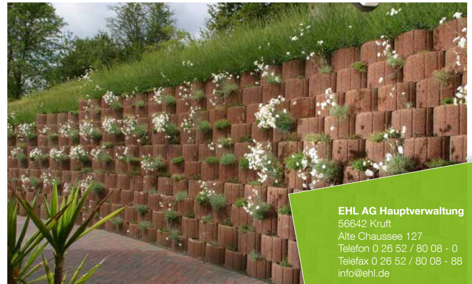
Farbe // braun

EHL AG Hauptverwaltung 56642 Kruft Alte Chaussee 127 Telefon 0 26 52 / 80 08 - 0 Telefax 0 26 52 / 80 08 - 88 info@ehl.de