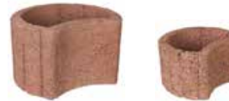
50 x 40 cm, 30 cm hoch