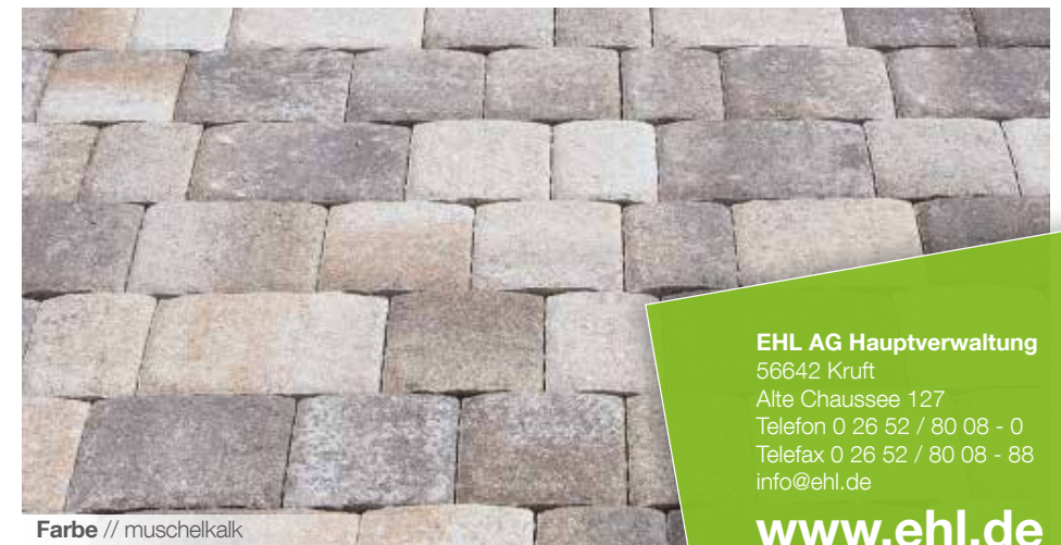
Farbe // muschelkalk

Verlegebeispiele zum jeweiligen Produkt finden Sie auf www.ehl-for-diy.de