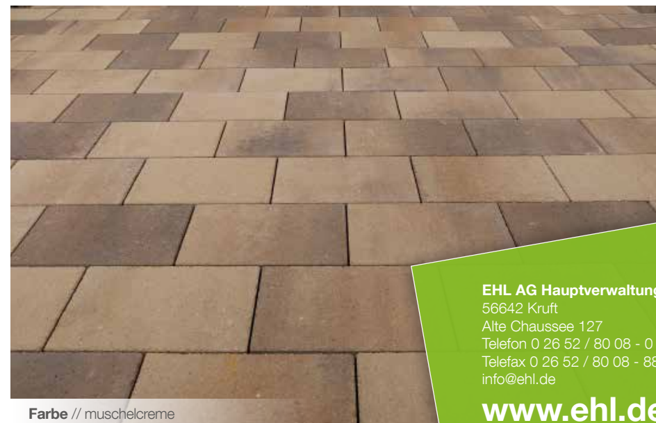
Farbe // muschelcreme

Verlegebeispiele zum jeweiligen Produkt finden Sie auf www.ehl-for-diy.de