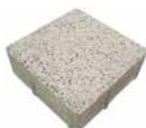
Format 20 x 20 cm