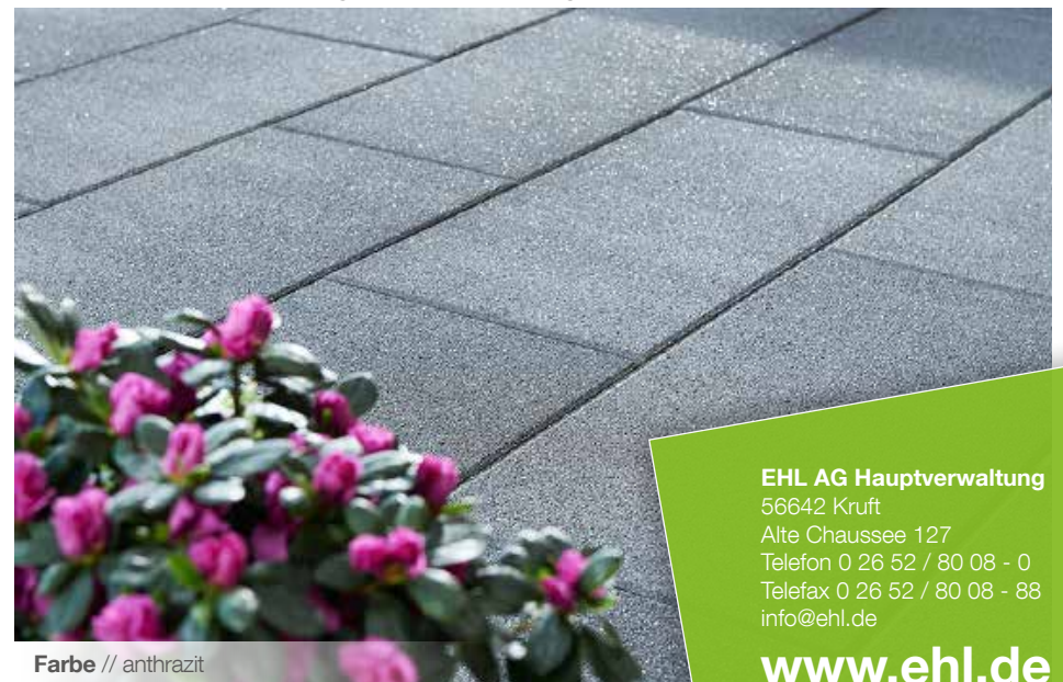
Farbe // anthrazit

Verlegebeispiele zum jeweiligen Produkt finden Sie auf www.ehl-for-diy.de