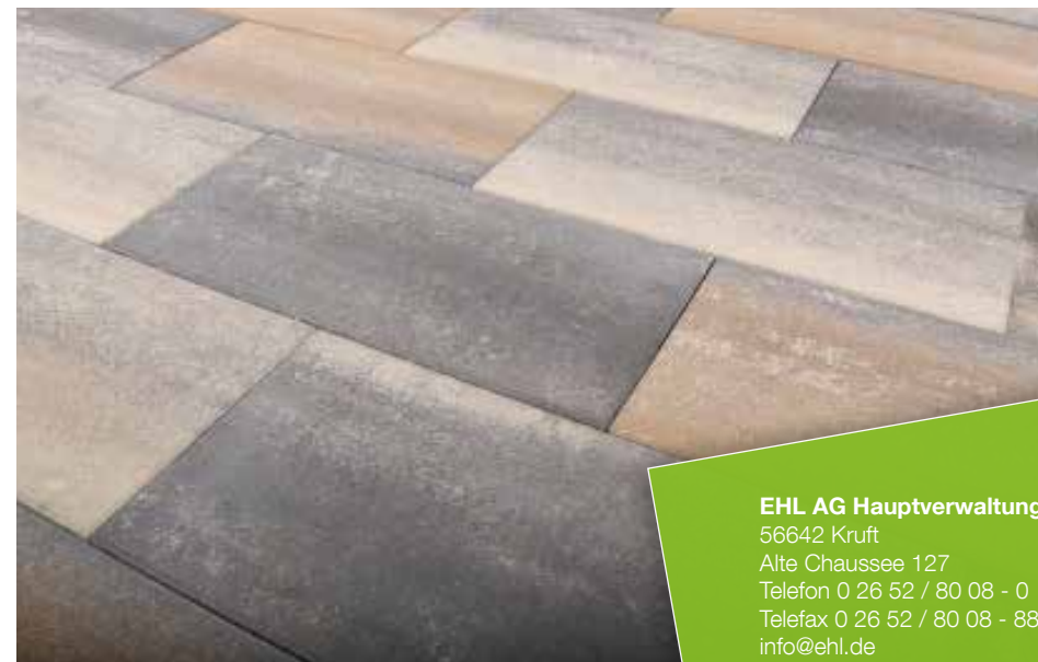
Farbe // muschelcreme

Verlegebeispiele zum jeweiligen Produkt finden Sie auf www.ehl-for-diy.de