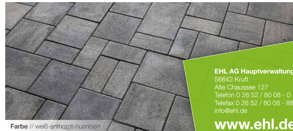
Farbe // weiß-anthrazit-nuanciert

Verlegebeispiele zum jeweiligen Produkt finden Sie auf www.ehl-for-diy.de