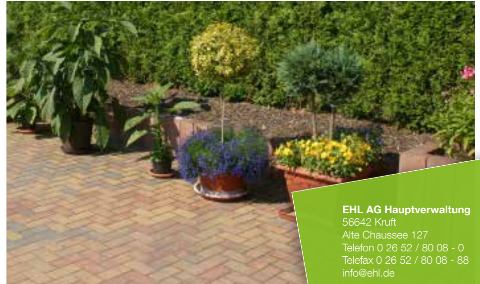
Farbe // herbstbunt

Verlegebeispiele zum jeweiligen Produkt finden Sie auf www.ehl-for-diy.de