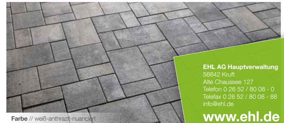
Farbe // weiß-anthrazit-nuanciert

Verlegebeispiele zum jeweiligen Produkt finden Sie auf www.ehl-for-diy.de