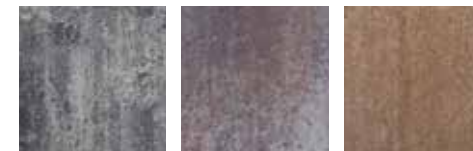
weiß-anthrazit-nuanciert muschelrot macchiato