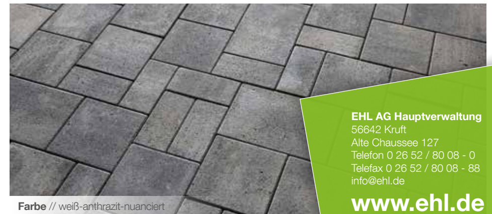
Farbe // weiß-anthrazit-nuanciert

Verlegebeispiele zum jeweiligen Produkt finden Sie auf www.ehl-for-diy.de