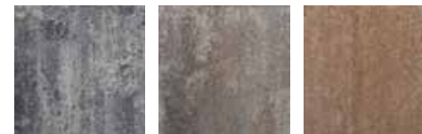
weiß-anthrazit-nuanciert muschelkalk macchiato