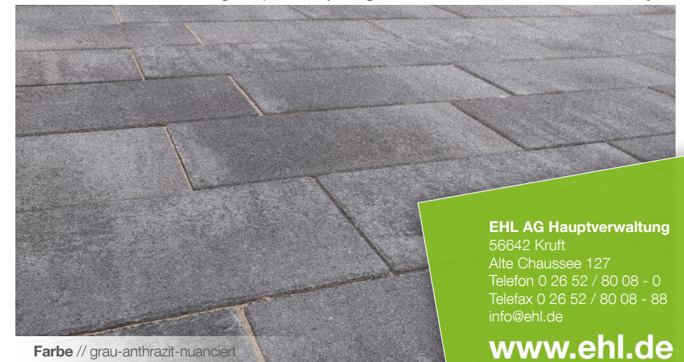
Farbe // grau-anthrazit-nuanciert

Verlegebeispiele zum jeweiligen Produkt finden Sie auf www.ehl-for-diy.de